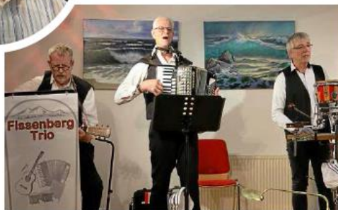
Das Fissenberg-Trio aus Abbensen begeistert die Zuschauer mit Songs op Platt, Schlagern und Evergreens.